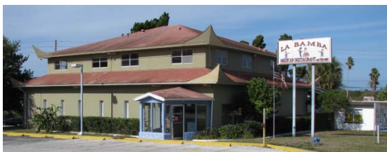
Propiedad vacante y a la venta en el Boulevard Gulf to Bay