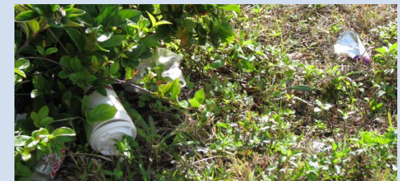
Ensucie on Cleveland