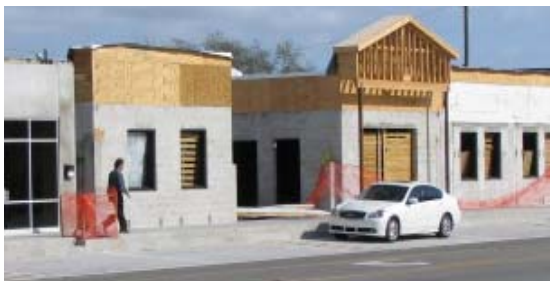
Mejoramiento de la fachada de una construcción en la calle Cleveland

E. 8 Publicitar y promocionar el uso de los programas de asistencia de vivienda de la ciudad para aumentar el número de propietarios en “East Gateway”.