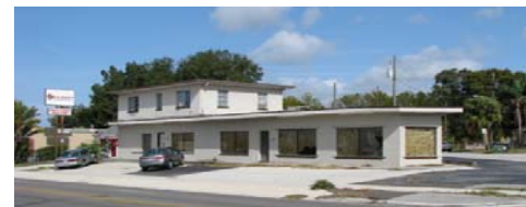
Tienda frontal con periódicos en las ventanas