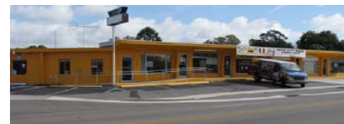
Color inapropiado para el distrito de "East Gateway"