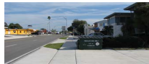
Basurero sin reja en frente de una casa