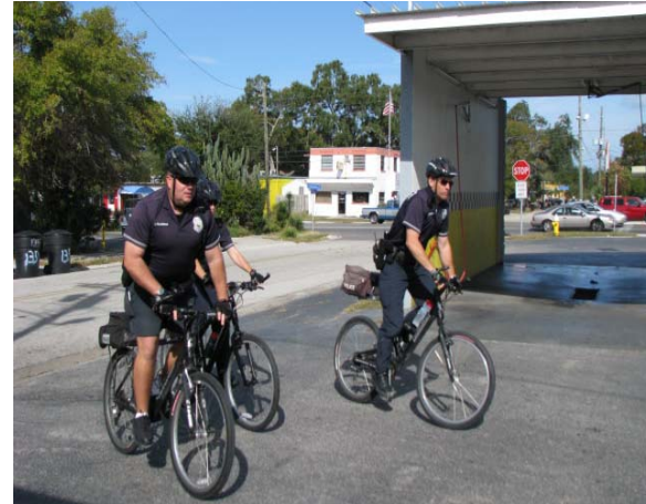
Patrulla de equipo de bicicleta "CHIP" en East Gateway