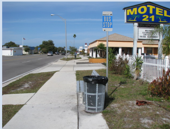
Parada de autobus en Gulf to Bay