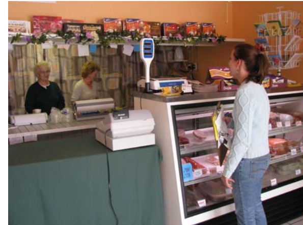
Visita al negocio "Polskie Produkty Juventus" en el Boulevard "Gulf to Bay"